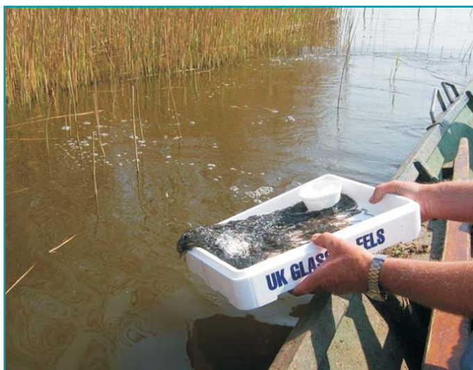
Uitzet van glasaal

Voor LNV is van belang dat de afspraak tussen Ministerie en Tweede Kamer, verwoord in de motie Koppejan c.s. (kamerstuk 29675 nr. 72) door het bedrijfsleven, volledig en toetsbaar wordt nagekomen. Dit houdt het volgende in: