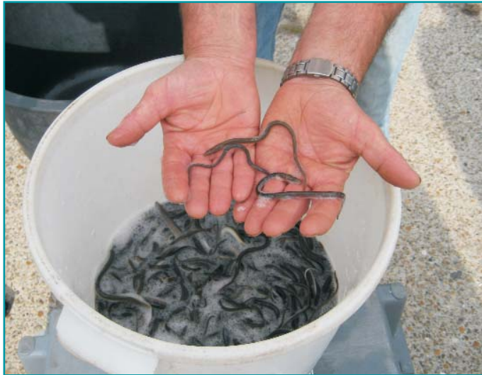
Pootaal voor uitzetting

PVis biedt aan om de ingediende plannen als gemandateerde subsidieverstrekker te behandelen volgens bovenstaande werkwijze. Voor de inhoudelijke beoordeling zal gebruik worden gemaakt van de expertise die verkregen kan worden van of via de stichting Future for Eel.