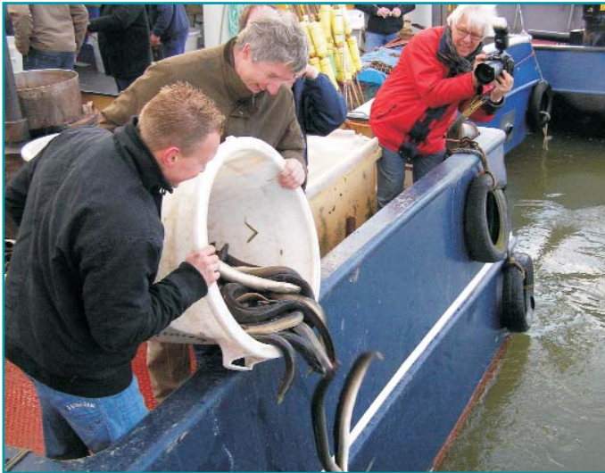
Uitzet van schieraal

In oktober 2008 heeft minister Verburg een Aalherstelplan aangeboden aan de Tweede Kamer. In het overleg tussen de minister en de Kamer is besloten dat in plaats van een stilligregeling voor de schieraalvisserij in de maanden september en oktober door de beroepsvissers op de binnenwateren in de periode augustus t/m december 2009 in totaal 157 ton schieraal zal worden gevangen en uitgezet op plaatsen waar vrije uittrek naar zee mogelijk is. Van deze 157 ton dient 50 ton schieraal van goede kwaliteit 1 te zijn. Voor dit schieraalproject heeft LNV een bedrag van € 700.000 beschikbaar gesteld.