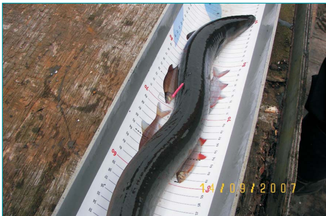
Lengtemeting bij onderzoek schieraal